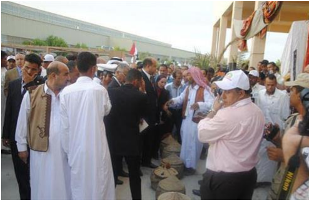
ختام الدورة الأولى لمهرجان التمور بسبوة

اختتمت محافظة مطروح فعاليات الدورة الأولى لمهرجان التمور المصرية بفوز 10 مزارعين بجوائز تقدر قيمتها المالية بـ200 ألف جنيه .