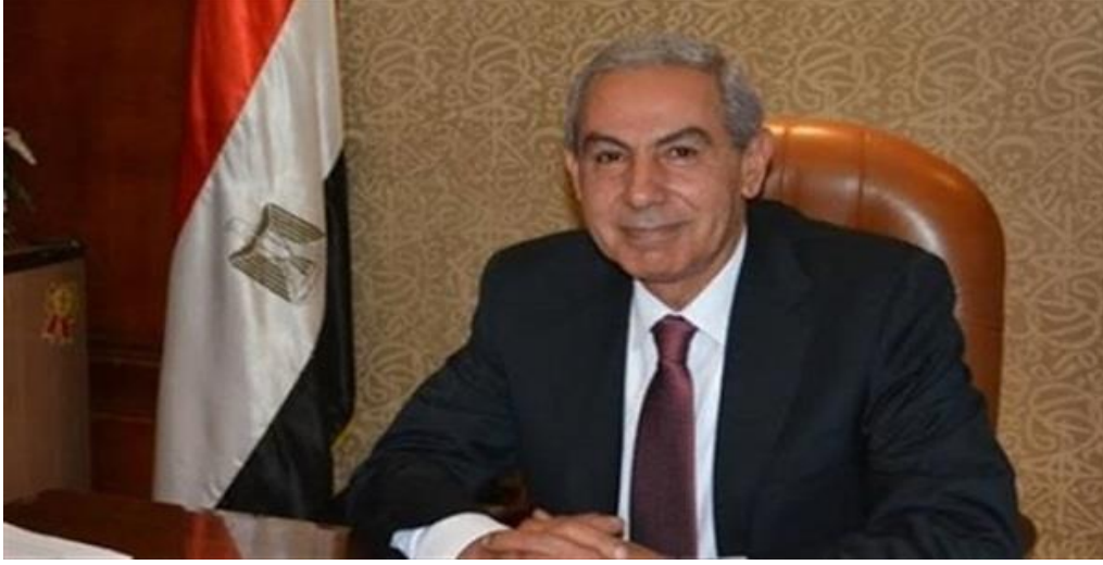
وزير الصناعة والتجارة