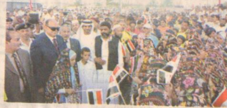
جانب من حفل اختتام مهرجان التمور