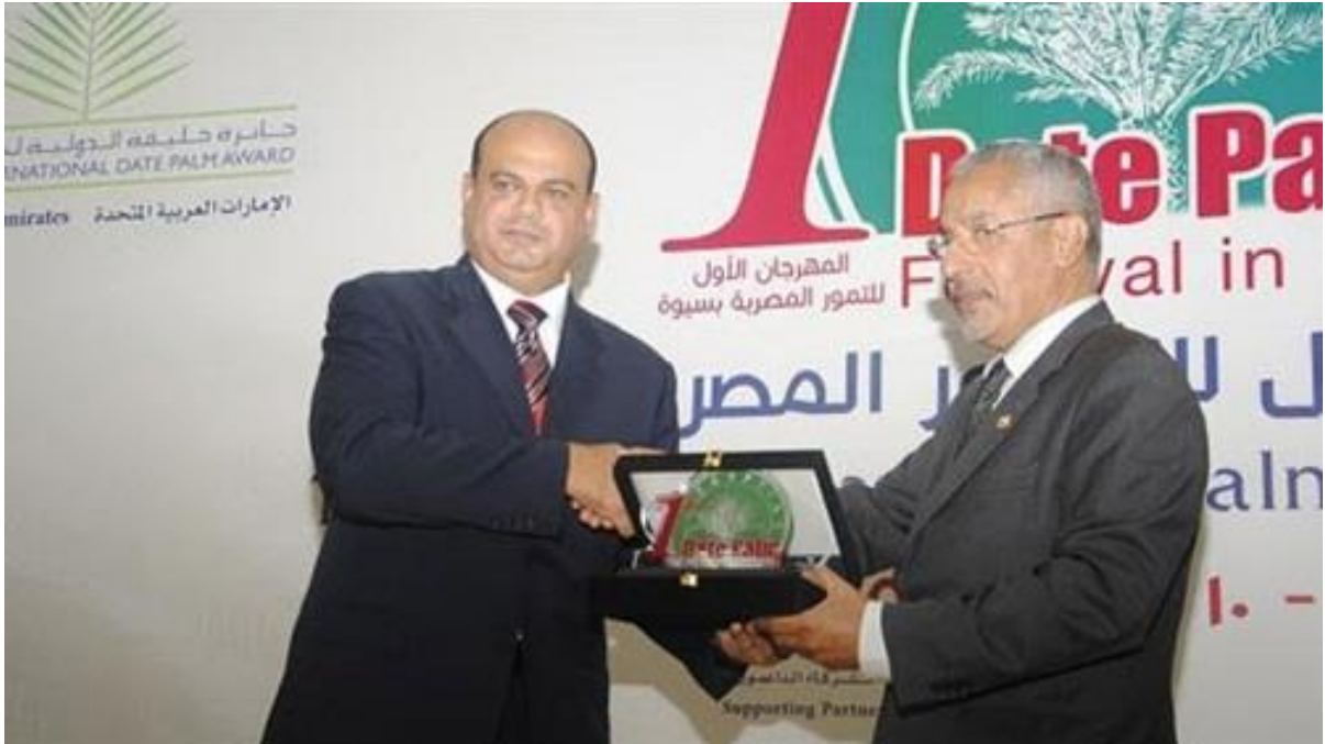
محافظ مطروح اللواء علاء أبو زيد