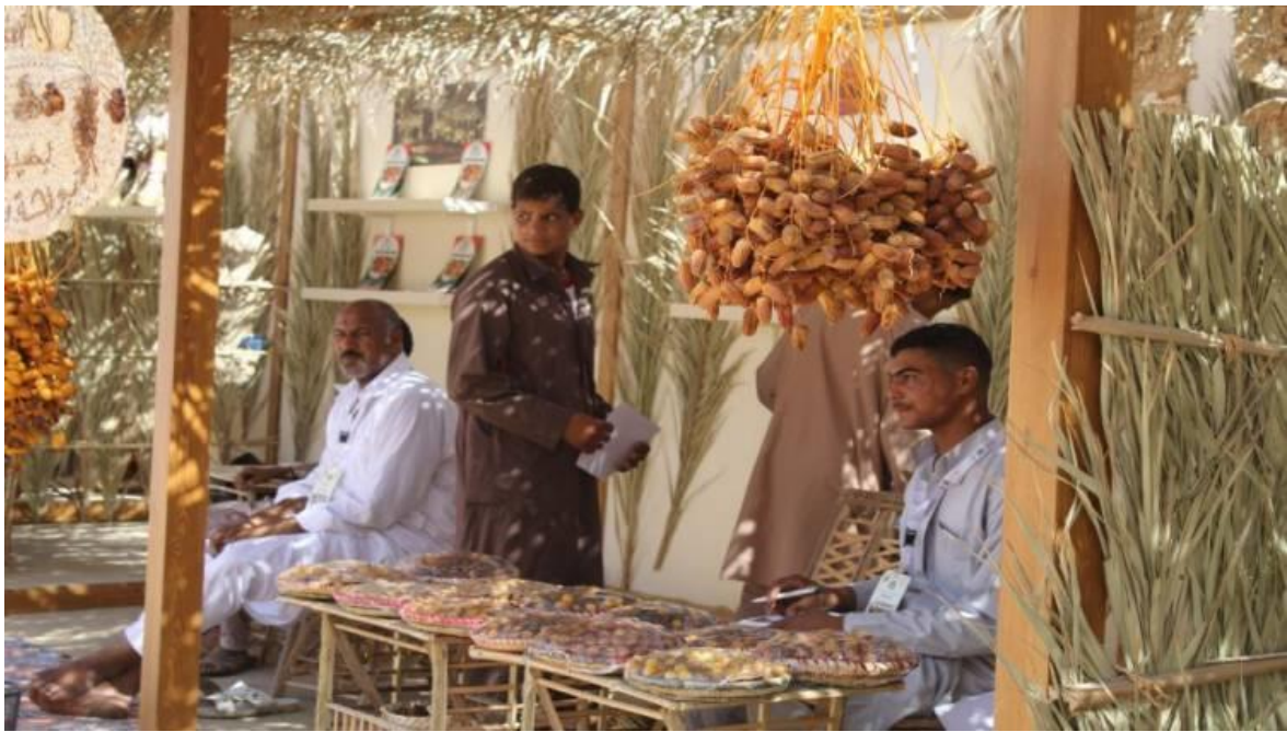
المهرجان الأول للتمور المصرية بسيوة