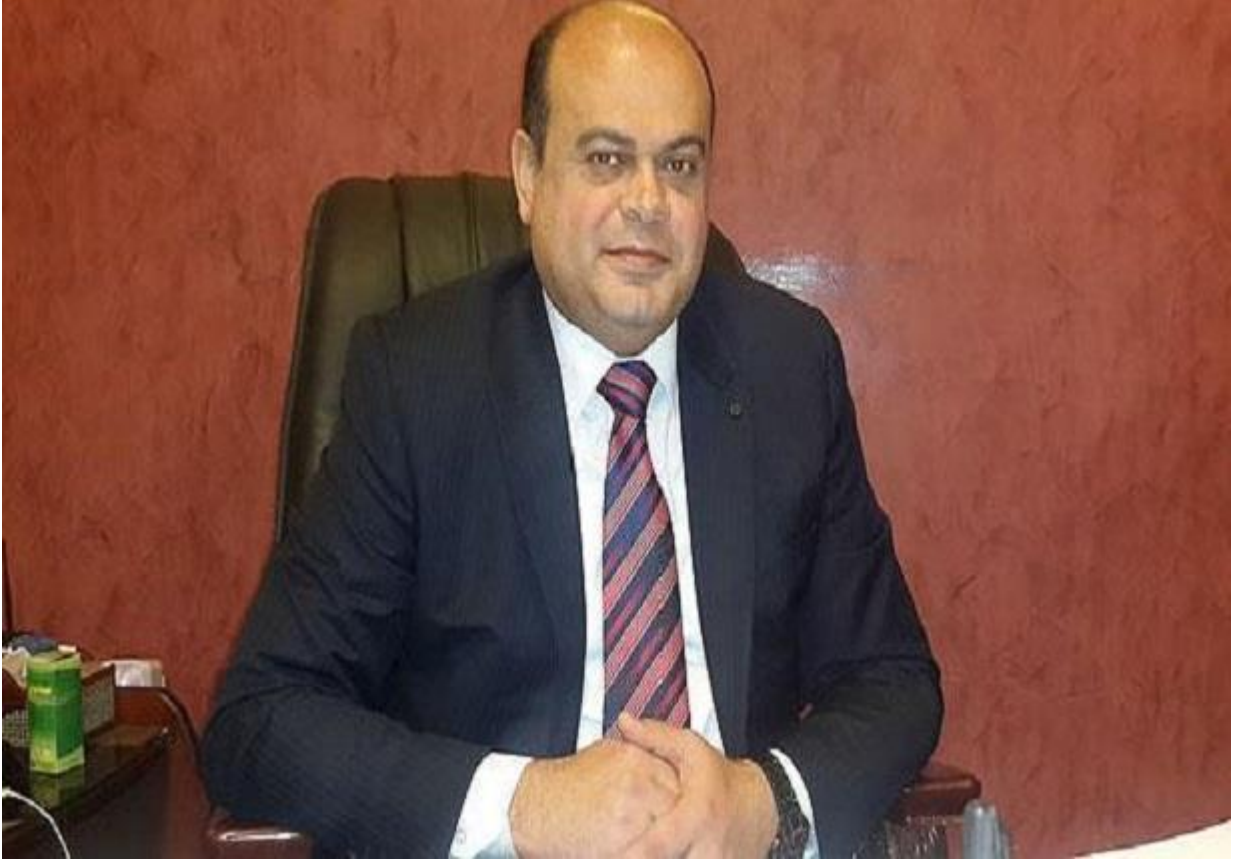
محافظ مطروح اللواء علاء أبو زيد