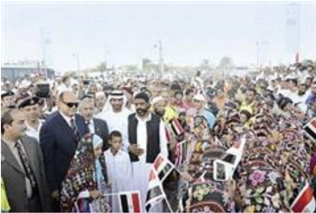
جانب من حفل اختتام مهرجان التمور