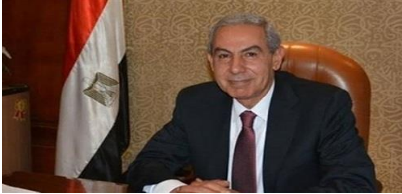
وزير التجارة والصناعة المهندس طارق قابيل

صرح وزير التجارة والصناعة المهندس طارق قابيل، بأن مصر تحتل المركز الأول عالمياً في إنتاج التمور، حيث بلغ حجم الإنتاج في عام 2013 نحو 1ر5 مليون طن.