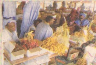
سوق البلح في سيوة

جمهورية مصر العربية، وتقديم الدعم لهذا القطاع والنهوض وعشائرية وثرائية. وأوضحت أن أكثر من ١١٠ شركات عالمية ومحلية تشارك في فعاليات المهرجان، بالإضافة إلى مشاركة أكثر من ٧٠ متسابقاً ضمن الفئات للمنافسة الخاصة بالمهرجان. الدكتور عبدالوهاب زايد، أمين عام جائزة خليفة الدولية لتخيل التمور، قال إن المبادرة إقامة مهرجان التمور المصرية بإقامة سيوة تهدف إلى الارتقاء بقطاع التخيل ووضع وتشجيع زراعة التمور المصرية، وإيجاد الحلول للمشاكل التي يعاني منها المزارع