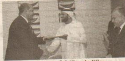
محافظ مطروح اثناء توقيع مذكرة التفاهم

زاييد: 80 شاركوا في أول مسابقة تقام خارج أبوظبي