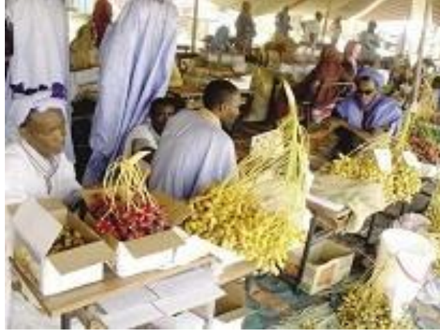
سوق البلح فى سيوة