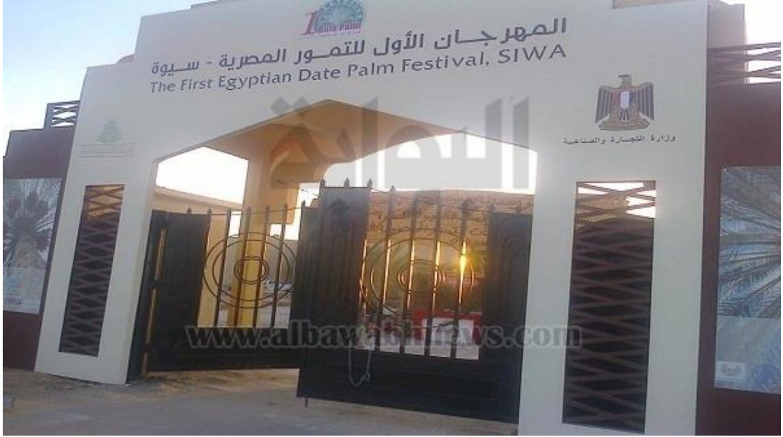
المهرجان الأول للتمور المصرية في سيوة