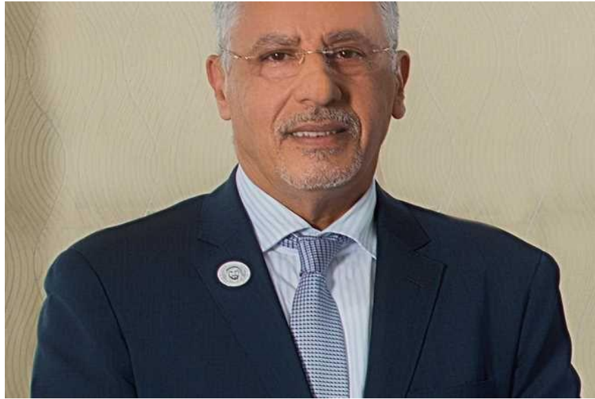
أبو ظبي