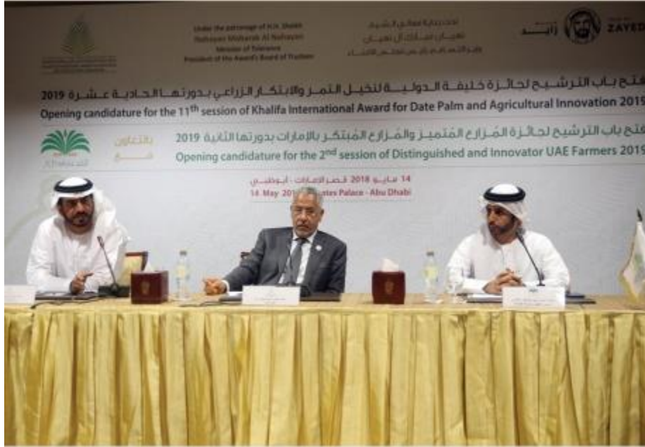
خلال المؤتمر الصحفي