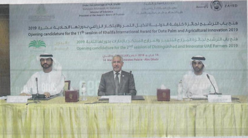
خلال المؤتمر الصحفي

أميركا بعدد مشاركين وصل الى 16 مشاركا، وثالثا باكستان بعدد مشاركين وصل الى 13 مشاركا. وعلى مستوى الفئات، سجلت فئة الدراسات والبحوث المتميزة أعلى نسبة مشاركة لحد الآن من بين الفئات كافة، حيث بلغ عدد المرشحين بهذه الفئة 586 مشاركا، وحلت فئة أفضل مشروع تنموي ثانيا بواقع 183 مرشحا، وفئة الابتكارات الرائدة ثالثا 182 مرشحا، وجاءت فئة أفضل شخصية متميزة بالمركز الرابع 160 مرشحا، وفئة أفضل إنتاج 68 مرشحا.