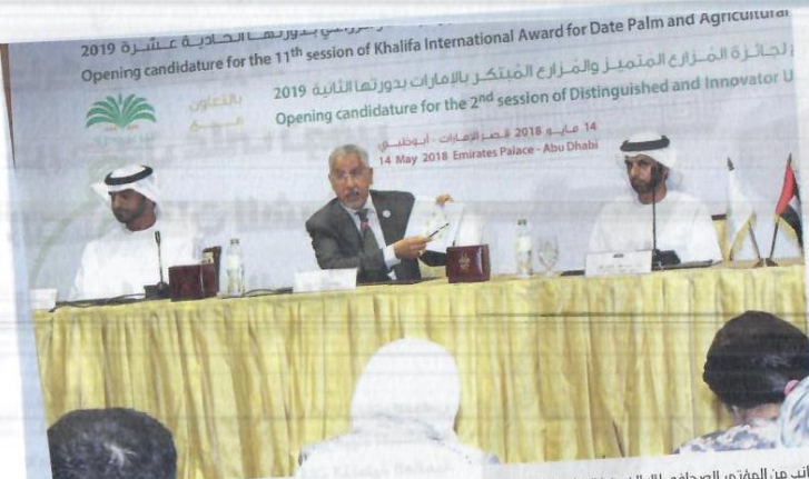
جانب من المؤتمر الصحافي للإعلان عن فتح باب الترشيح لجائزة خليفة الدولية لنخيل التمر والابتكار الزراعي أمس في أبوظبي. (الرؤية)