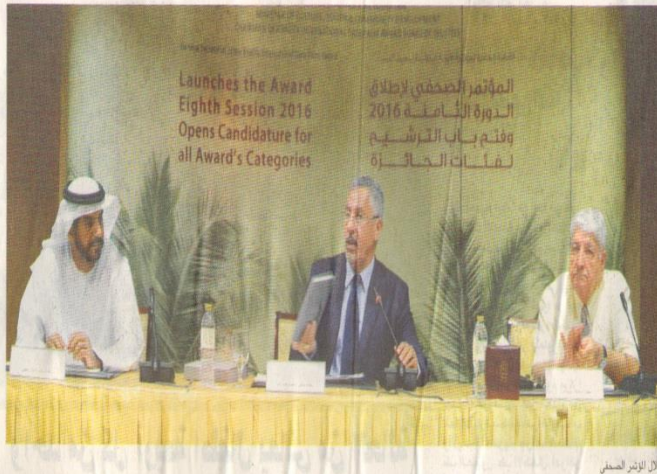
خلال المؤتمر الصحفي

٩٩ ٨٠٩ مشاركات من ٣٩ دولة في نهاية الدورة السابعة