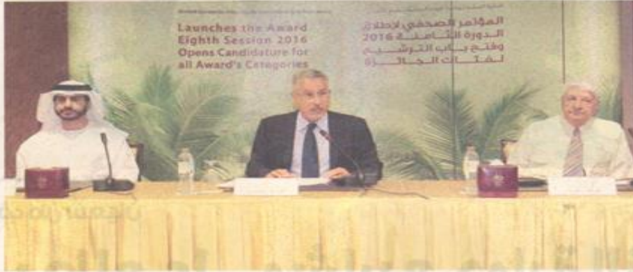
خلال الإعلان عن فئات الدورة الجديدة (من المصغر)

أعلنت الأمانة العامة لجائزة خليفة الدولية لنخيل التمر فتح باب الترشيح لدورتها الثامنة 2016 في هاتنا الخمس، وتشمل فئة الشخصية المتميزة، فئة أفضل مشروع تنموي، فئة أفضل تقنية، فئة المنتجين المتميزين، وفئة البحوث والدراسات المتميزة في مجال زراعة النخيل وإنتاج التمور، وذلك اعتباراً من الأول من يونيو الجاري وحتى 30 أكتوبر المقبل، ويحصل الفائز بالمركز الأول في كل فئة على مبلغ قدره 300,000 درهم ودرع تذكارية وشهادة تقدير، فيما يحصل الفائز بالمركز الثاني على مبلغ 200,000 درهم ودرع تذكارية وشهادة تقدير.