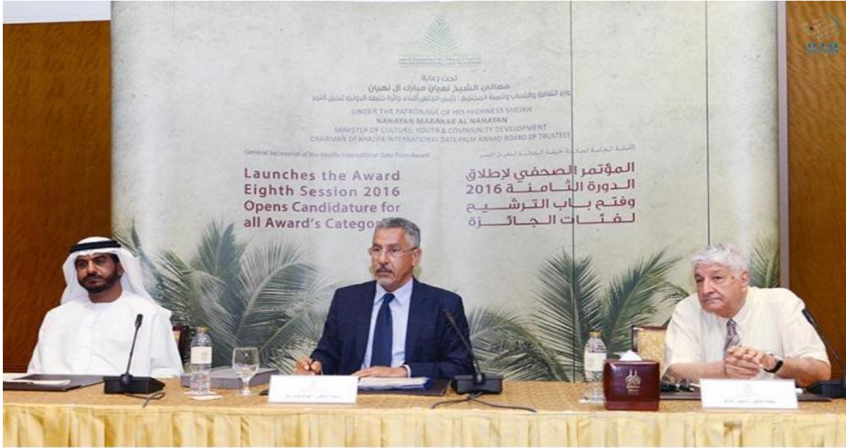
جائزة خليفة الدولية لنخيل التمر تفتح باب الترشيح لدورتها الثامنة 2016.

ابوظبي في 2 يونيو/وام/ أعلنت الأمانة العامة لجائزة خليفة الدولية لنخيل التمر عن فتح باب الترشيح حتى الثلاثين من أكتوبر القادم للدورة الثامنة 2016 للجائزة في فئاتها الخمس لجميع المزارعين والمنتجين والباحثين والخبراء والأكاديميين والمختصين والدارسين وكافة محبي شجرة نخيل التمر على مستوى العالم.