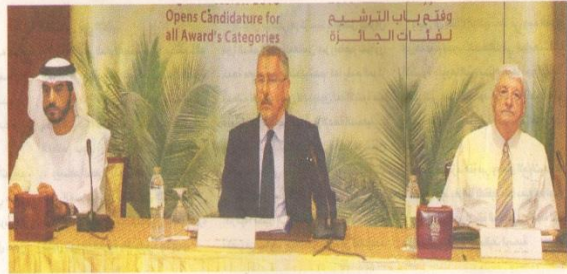
جانب من المؤتمر الصحافي للإعلان عن فتح باب الترشيح لجائزة خليفة الدولية لنخيل التمر 2016 في أبوظبي، أمس.