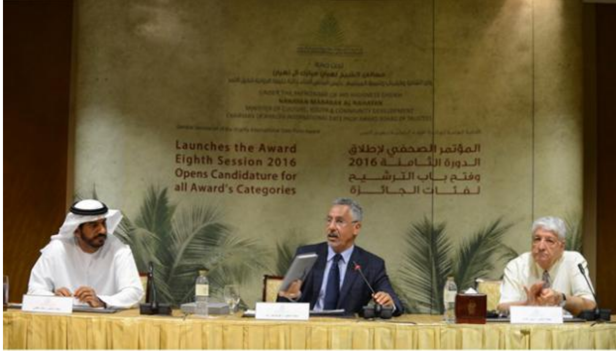
جائزة خليفة الدولية لنخيل التمر تفتح باب الترشيح لدورتها الثامنة 2016.