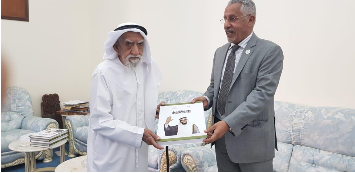
سعادة / سلطان الكويتي