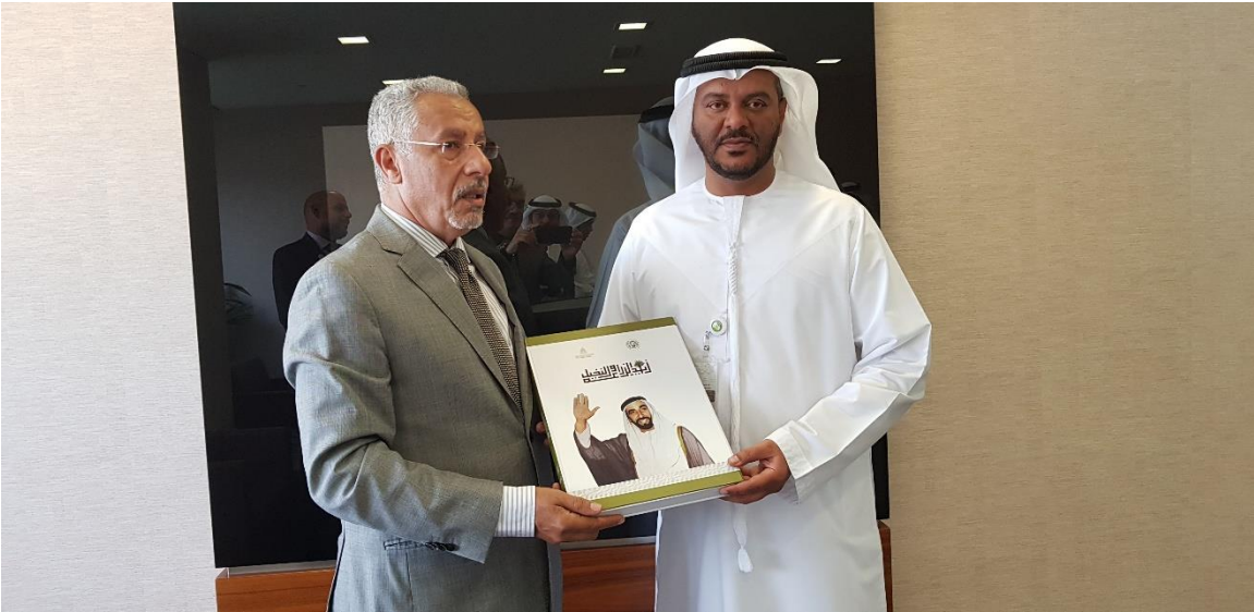
سعادة ناصر محمد الجنيني