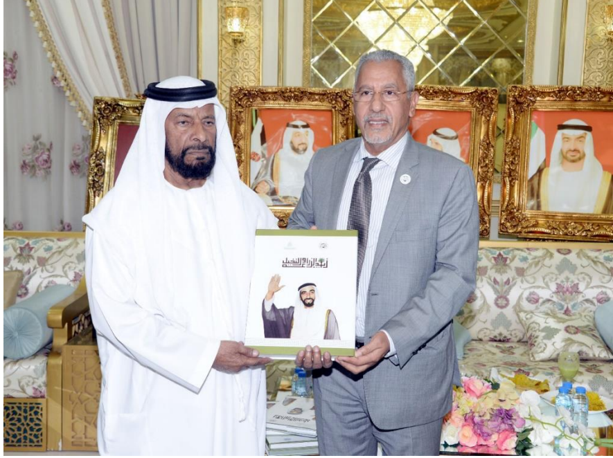
سعادة / محمد بن ركاض العامري