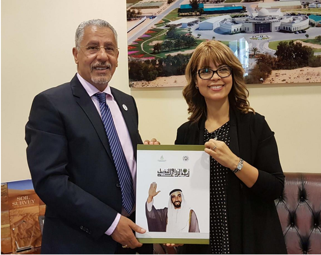
سعادة الدكتورة / أسمهان الوافي - مدير عام المركز الدولي للزراعة الملحية