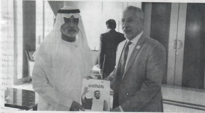
نهيان مبارك خلال إطلاق الكتاب