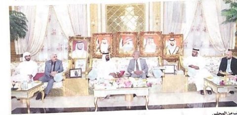
جانب من المجلس