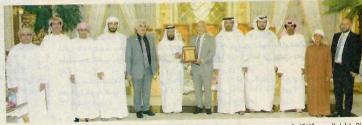
خلال تبادل الدروع التذكارية