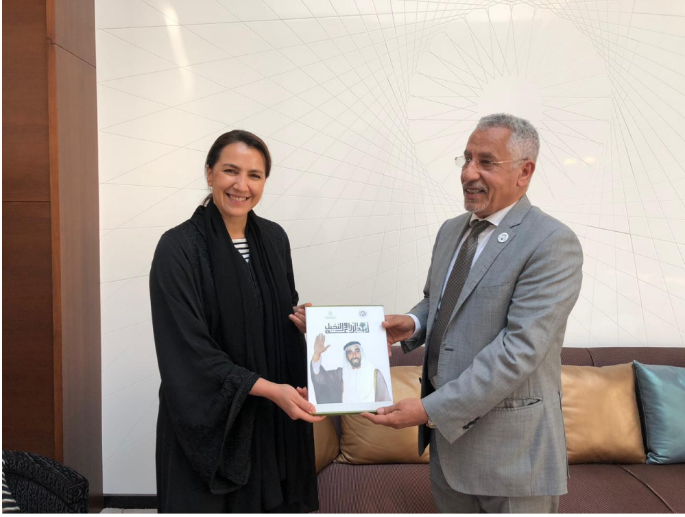
معالي الوزيرة / مريم المهيري - وزيرة الأمن الغذائي