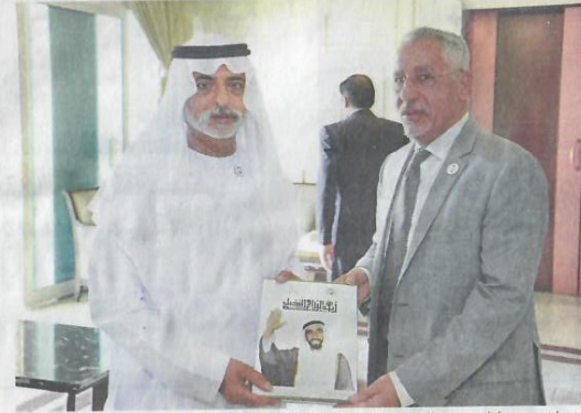
نهيان بن مبارك وعبد الوهاب زايد خلال إطلاق الكتاب

ثراه، باني النهضة الزراعية في دولة الإمارات بالمحافظة على إرثه الزراعي والمضي قدماً على خطى صاحب السمو الشيخ خليفة بن زايد آل نهيان رئيس الدولة، حفظه الله وتوجيهات صاحب السمو الشيخ محمد بن زايد آل نهيان ولي عهد أبوظبي نائب القائد الأعلى للقوات المسلحة، ودعم سمو الشيخ منصور بن زايد آل نهيان، نائب رئيس مجلس الوزراء، وزير شؤون الرئاسة. أبوظبي - وا،