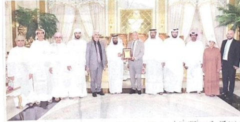
محمد بن ركاض يقدم درعاً تذكاريًا إلى أمين عام جائزة خليفة لتخليد النمر