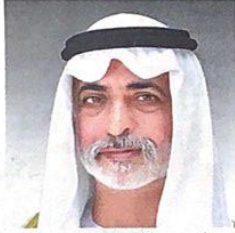
■ نهيان بن مبارك

كما جرى إطلاق الدورة الثانية من جائزة المزارع المتميز والمزارع المبتكر في مايو 2018 بالتعاون مع شركة الفوعة، وإطلاق كتاب خاص أيضاً بعنوان «زايد الزراعة والنخيل» في شهر نوفمبر 2018، وفي ديسمبر 2018 جرى افتتاح معرض أبوظبي الدولي للتمور بالتوازي مع معرض سيال أبوظبي الشرق الأوسط 10 - 12 ديسمبر 2018.