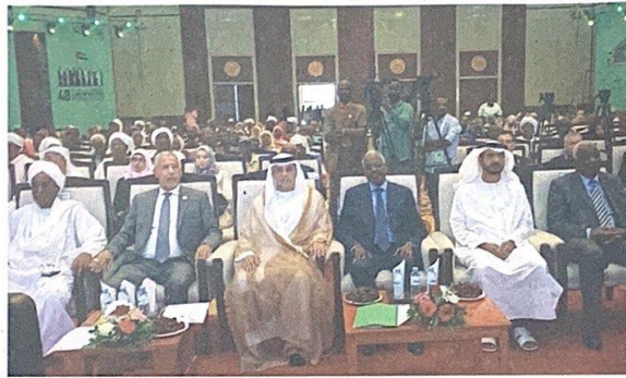
جانب من المشاركين

وأكد سعادة الدكتور هلال حميد ساعد الكعبي، عضو مجلس أمناء الجائزة، أن مبادرة إقامة المهرجان الدولي الثالث للتمور السودانية بالخرطوم تهدف إلى الارتقاء بقطاع النخيل ودعم وتنشيط زراعة التمور السودانية، وإيجاد الحلول للمشاكل التي يعاني منها المزارع السوداني، من عدم توافر أصناف ذات جودة عالية، والمساهمة في مكافحة آفات النخيل، بالإضافة إلى تحسين جودة الإنتاج والتغليب والتعليب، وأشار إلى أن هناك فكرة مشروع وطني لتطوير زراعة النخيل بجمهورية السودان لما لدولة الإمارات من خبرة كبيرة في هذا المجال.