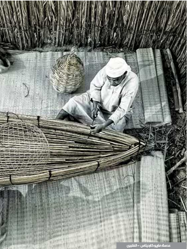
عدسة: ماريو كارديناس - الفلبين