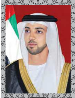
سمو الشيخ منصور بن زايد آل نهيان نائب رئيس مجلس الوزراء وزير شؤون الرئاسة