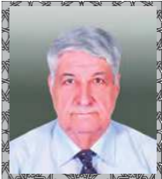
الأستاذ الدكتور سمير الشاكر عضو اللجنة العلمية خبير دولي