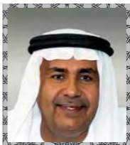
سعادة الدكتور غالب علي الحضرمي نائب مدير الجامعة لشؤون الطلبة والتسجيل - جامعة الإمارات العربية المتحدة