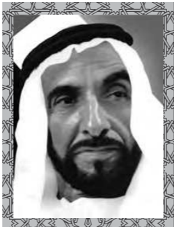
المغفور له بإذن الله الشيخ زايد بن سلطان آل نهيان (طيب الله ثراه)