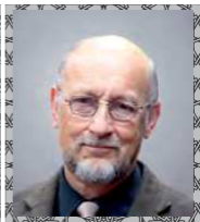
الأستاذ الدكتور فرانز هوفمان رئيس اللجنة العلمية الولايات المتحدة الأمريكية