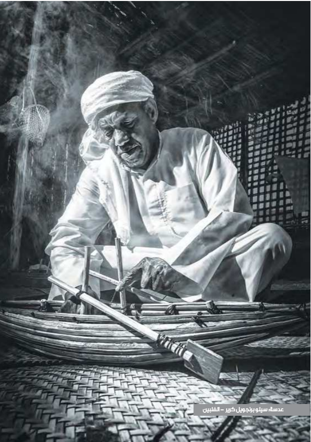
عدسة، سيلو بنجويل كير - الفلبين