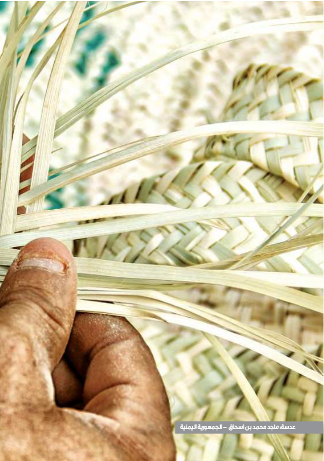
عدسة، ماجد محمد بن اسحاق - الجمهورية اليمنية