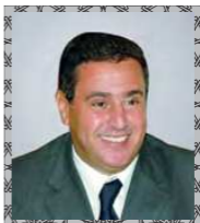
معالي عزيز أخنوش وزير الفلاحة والصيد البحري المملكة المغربية