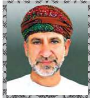
معالي الدكتور طارق بن موسى الزدجالي

المدير السابق للمنظمة العربية للتنمية الزراعية