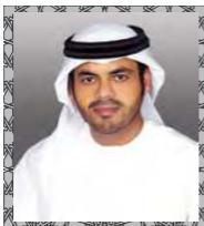
سعادة المهندس سيف محمد الشرع الوكيل المساعد للشؤون الزراعية والحيوانية بوزارة البيئة والمياه