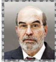
معالي جوزية جرازيانو دا سيلفا

المدير السابق لمنظمة الأغذية والزراعة التابعة للأمم المتحدة