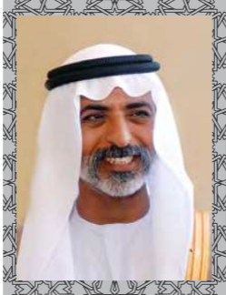
معالي الشيخ نهيان مبارك آل نهيان وزير الثقافة والشباب وتنمية المجتمع رئيس مجلس الأمناء