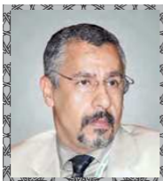
سعادة الاستاذ الدكتور عبد الوهاب زايد مستشار وزارة شؤون الرئاسة أمين عام الجائزة