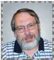
الأستاذ الدكتور هاريسون هيوز عضو اللجنة العلمية الولايات المتحدة لأمريكية