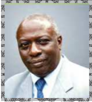
معالي الدكتور جاك ضيوف

المدير السابق لمنظمة الأغذية والزراعة التابعة للأمم المتحدة