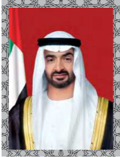
صاحب السمو الشيخ محمد بن زايد آل نهيان ولي عهد أبوظبي نائب القائد الأعلى للقوات المسلحة