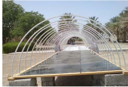
(a) Tunnel placed on concrete block substructures showing collector part (black painted metallic sheets)

تم استخدام نصف مساحة قاعدة النفق (2م×2م = 4م 2 ) كمساحة لتجميع الأشعة الشمسية، بينما تم استخدام النصف المتبقي من المساحة للتجفيف. تم تدعيم القاعدة الخشبية بشبكة من السلك المعدني. استخدمت أنواح معدنية مطلية باللون الأسود لامتصاص الأشعة في منطقة تجميع الأشعة، بينما تم نشر شبكة سلكية في منطقة التجفيف لتساعد في تجفيف المنتج.