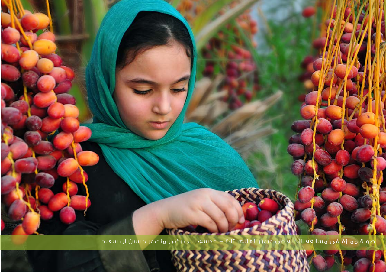
صورة مميزة في مسابقة النظلة في عيون العالم ٢٠١٤