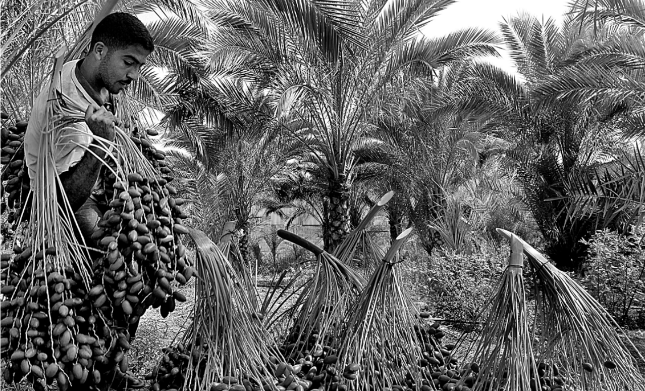
صورة مُميرة في مسابقة اللّفة فيّ عيون العالم ٢٠١٤ - عدسة: محمد اسعد محمد محبلسن