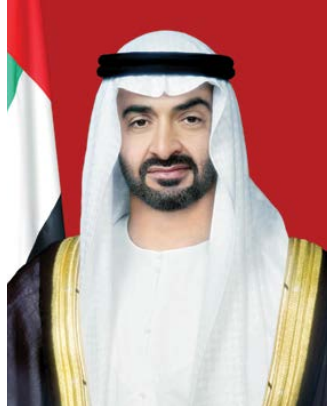
الفريق أول سمو الشيخ محمد بن زايد آل نهيان ولي عهد أبوظبي نائب القائد الأعلى للقوات المسلحة