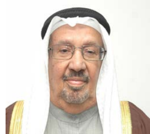
معالي الشيخ إبراهيم بن حمد بن عبد الله آل خليفة مملكة البحرين

في العام 1971 م عمل مع سمو الشيخ عبد الله بن خالد آل خليفة وزير البلديات والزراعة آنذاك في خدمة العمران والزراعة والمزارعين، وكان معاليه مديراً لإدارة الزراعة محباً هاوياً وعاشقاً للزراعة وداعماً للقطاع الزراعي والمزارعين حيث كانت دائرة الزراعة خلال فترة إدارته تقدم الإرشادات والمساعدات الفنية والمالية للمزارعين لتطوير إنتاجهم. وفي العام 1972 م ترك العمل الحكومي وتفرغ للأعمال الحرة والتجارة. بعد معاليه محباً لزراعة النخيل ومهتماً بتطوير إنتاجها من خلال اعتماد التكنولوجيا الحديثة واكتاره بطريقة زراعة الأنسجة ومكافحة الآفات والأمراض التي تصيب النخيل.