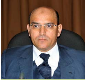
الدكتور حسن أوريد الملكة المغربية

حياته: ولد بمدينة الراشدية المغربية، وتلمذ في المدرسة المولوية بالرباط مع الملك محمد السادس الذي كان وليا للمعهد حينها. حصل على البكالوريا ليدخل كلية الحقوق والعلوم السياسية بالرباط، وتخرج منها بشهادة الإجازة في القانون العام، ودبلوم الدراسات المعمقة. وقد ناقش رسالة الدكتوراه في العلوم السياسية سنة 1999 في موضوع "الخطاب الاحتجاجي للحركات الإسلامية والأمازيغية في المغرب".