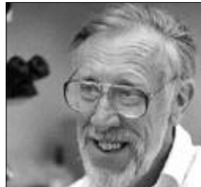
الفضة الخامسة - فئة الشخصية المتميزة الفاخر، ب. باري توملينسون المملكة المتحدة

ب. باري توملينسون - جامعة هارفارد (أستاذ فخري لعلم النبات) أستاذ علم النباتات الاستوائية وعالم مقيم، الحديقة الوطنية للنباتات الاستوائية، كامبونج، 4013 دوغلاس رود، ميامي، فلوريدا 33133، الولايات المتحدة الأمريكية.