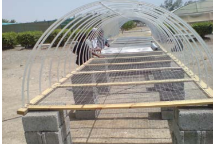
(b) Tunnel placed on concrete block substructures showing dryer part without wooden base over the metallic net