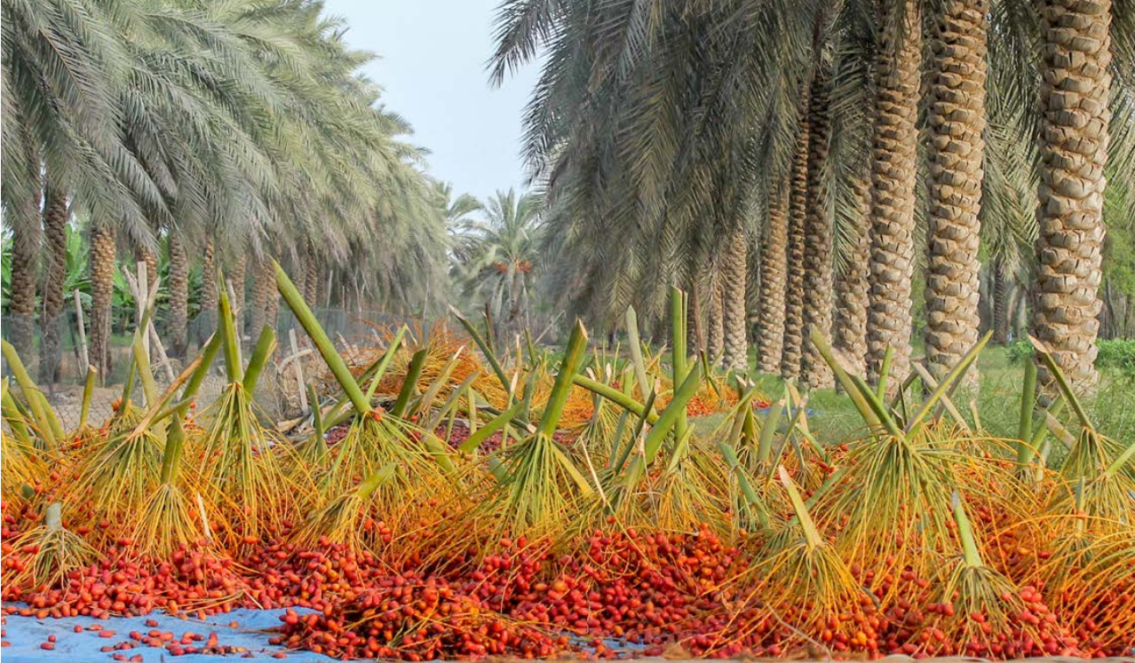
صورة مميزة في مسابقة النضلة في عيون العالم ٢٠١٤