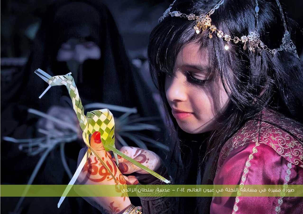
صورة مميزة في مسابقة النخلة في عيون العالم ٢٠١٤