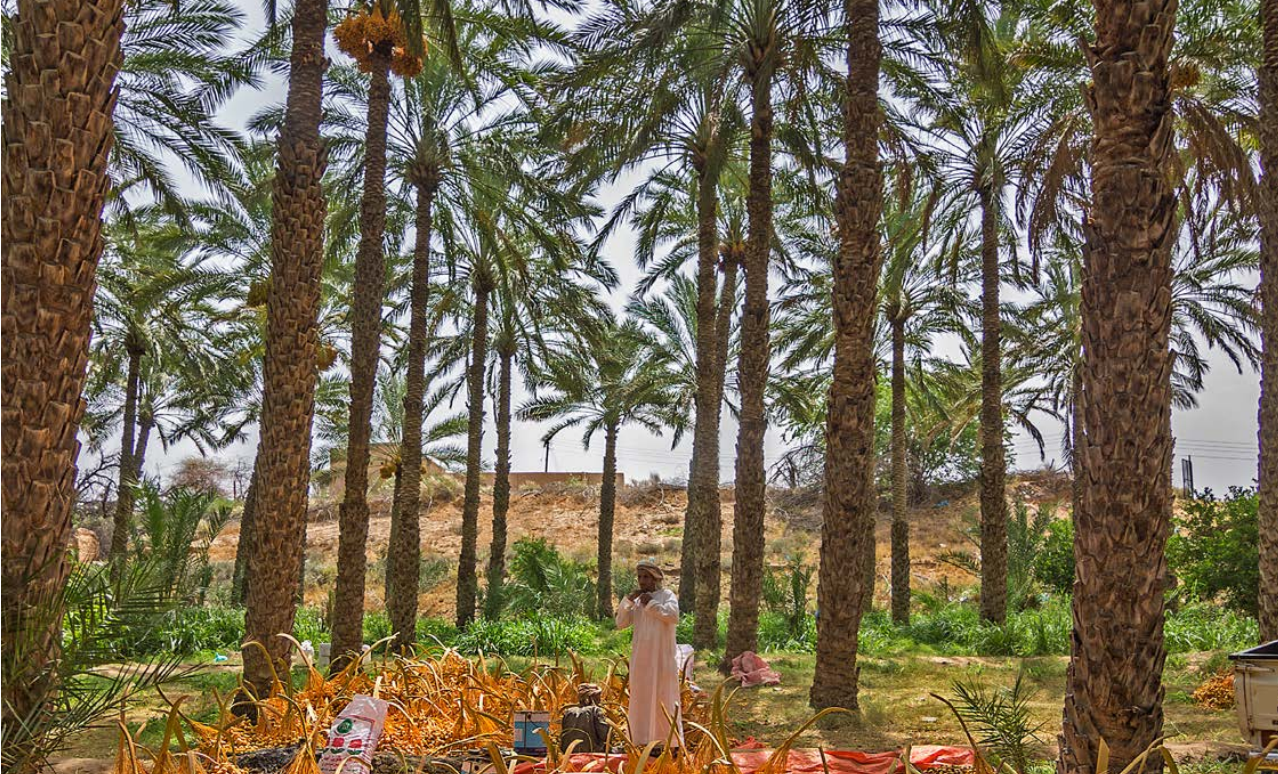
صورة مميزة في مسابقة النخلة في عيون العالم، ٢٠١٤