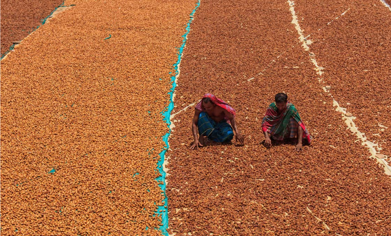
صورة مميزة في مسابقة اللقطة في عيون العالم، ٢٠١٤