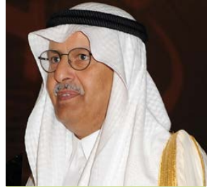
معالي الدكتور فهد بن عبد الرحمن بالفنيم المملكة العربية السعودية