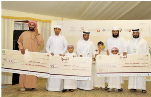
صورة للفائزين بهرجان ليوا للربط