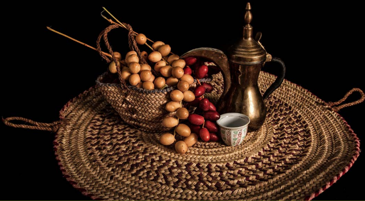
صورة مميزة في مسابقة النخلة في عيون العالم ٢٠١٤ - عدسة: محمد بن كمدان بن سالم الحجري