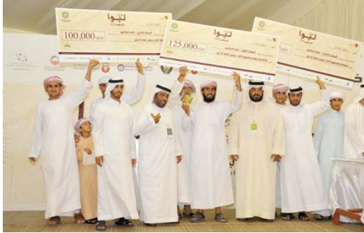
صورة للفائزين بمهرجان ليوا للربط

على المركز الثاني في فئة الخلاص، وشاركنا في مسابقة تغليف التمورر الأولى، وقمت بزراعة العديد من النخيل عالية الجودة والتأدية للتميز في إنتاج التمورر.