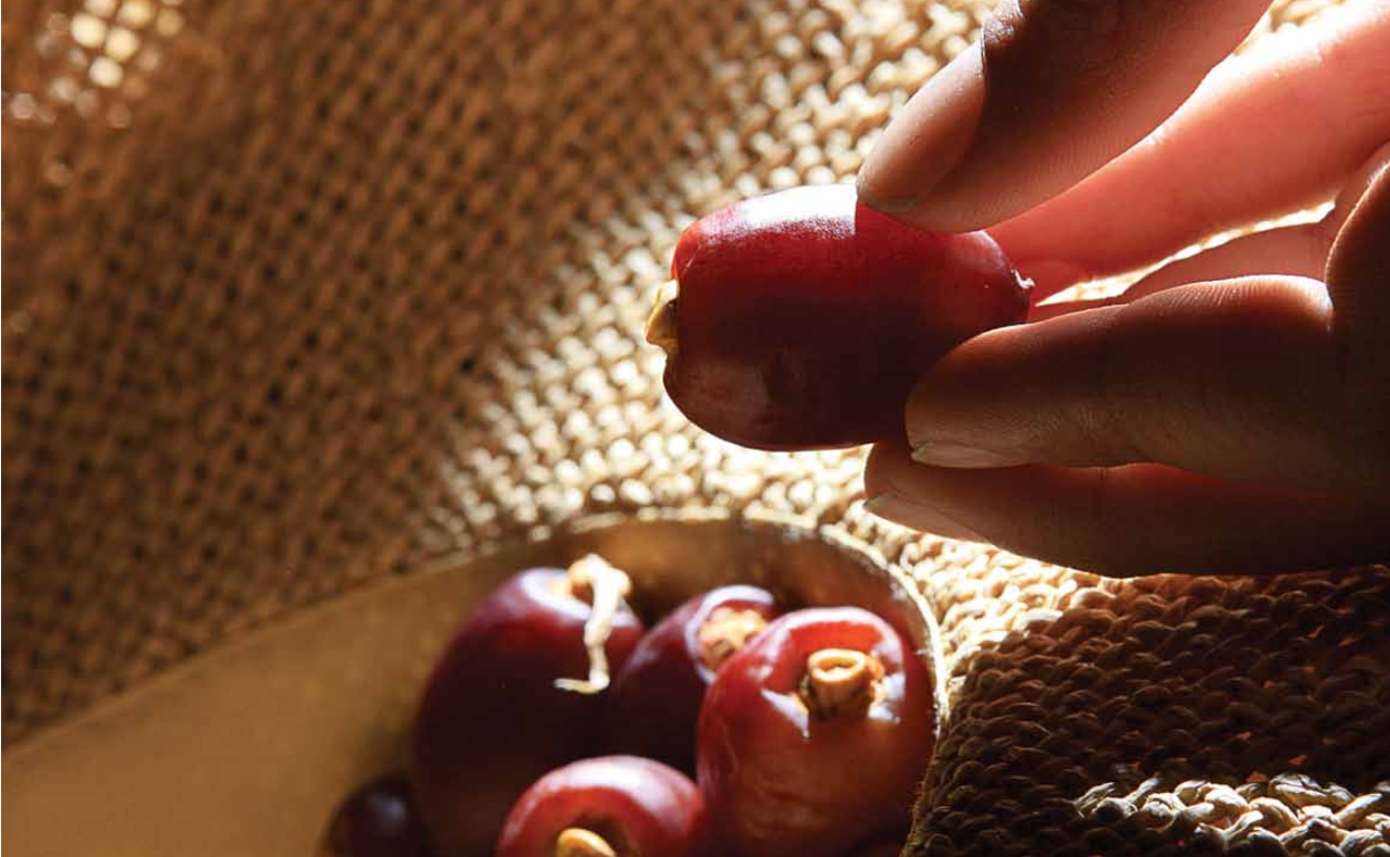
صورة مميزة في مسابقة النخلة في عيون العالم 2011