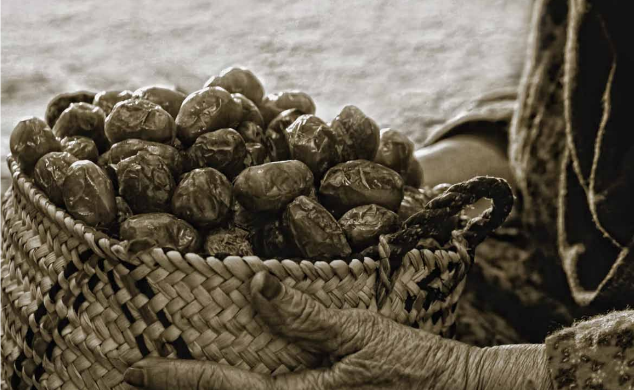
صورة مميزة في مسابقة النخلة في عيون العالم 2011