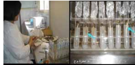
تطوير تقنية حيوية سريعة للانتقاء سلالات النخيل الهجينة داخل الأنابيب الزجاجية باستخدام المادة السامة للفطر المسبب لمرض البيوض على النواة التي تنمو على وسط غذائي الذي أضيفت له المادة السامة.