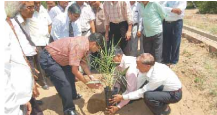
زراعة أول عرسة نخيل نسيجي من قبل نائب رئيس «RHDS» في موقع جودهوور

ستساعد الجهود المشتركة لشركة "أقول" وحكومة راجيستان بهذا الاتجاه المزارعين على الحصول على عراس نخيل تمر بأسعار مدعومة حكومياً وتشجع اكتثار واسع النطاق لهذا المحصول في حقول المزارعين بالهند، وستقوم شركة