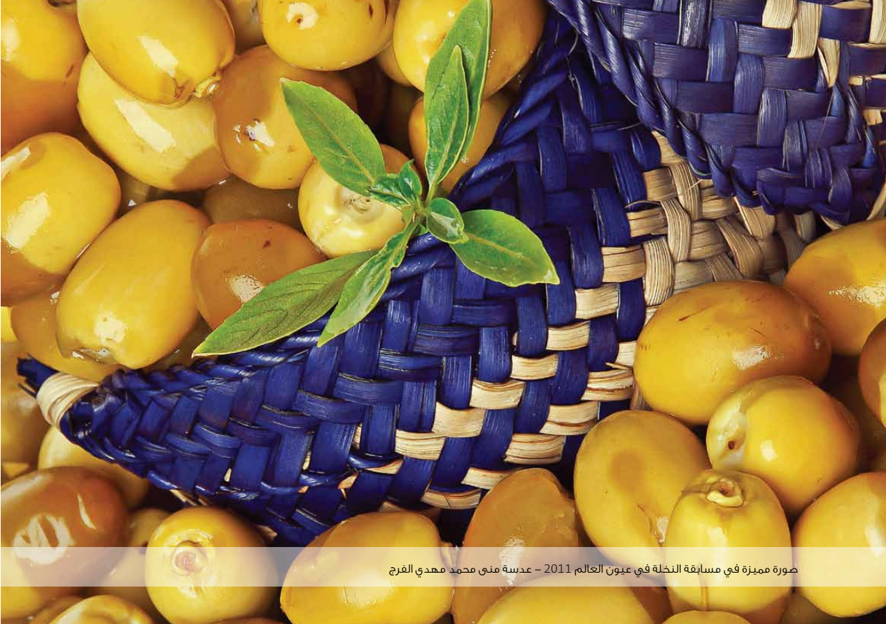
صورة مميزة في مسابقة النخلة في عيون العالم 2011