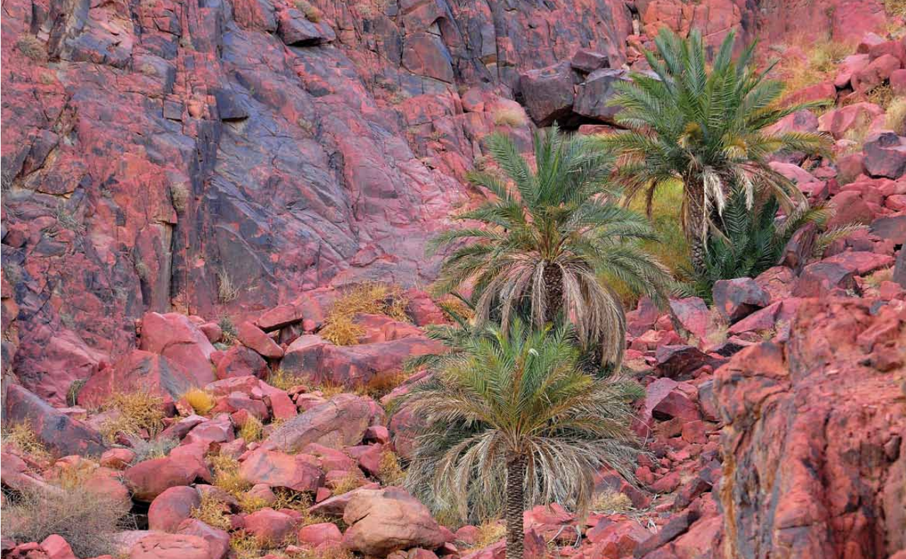
صورة مميزة في مسابقة النخلة في عيون العالم 2011