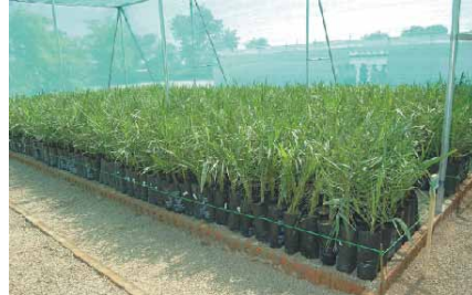
مشتل غراس نخيل تمر بزراعة الأنسجة

وبناءً على الاتفاقية التعاقدية الموقعة مع حكومة راجيستان، بدأت "أتول" باستيراد غراس نخيل تمر بزراعة الأنسجة من الامارات العربية المتحدة. أنشأت "أتول" مشتلاً في جودهور في راجيستان وبدأت باستيراد غراس جاهزة للزراعة