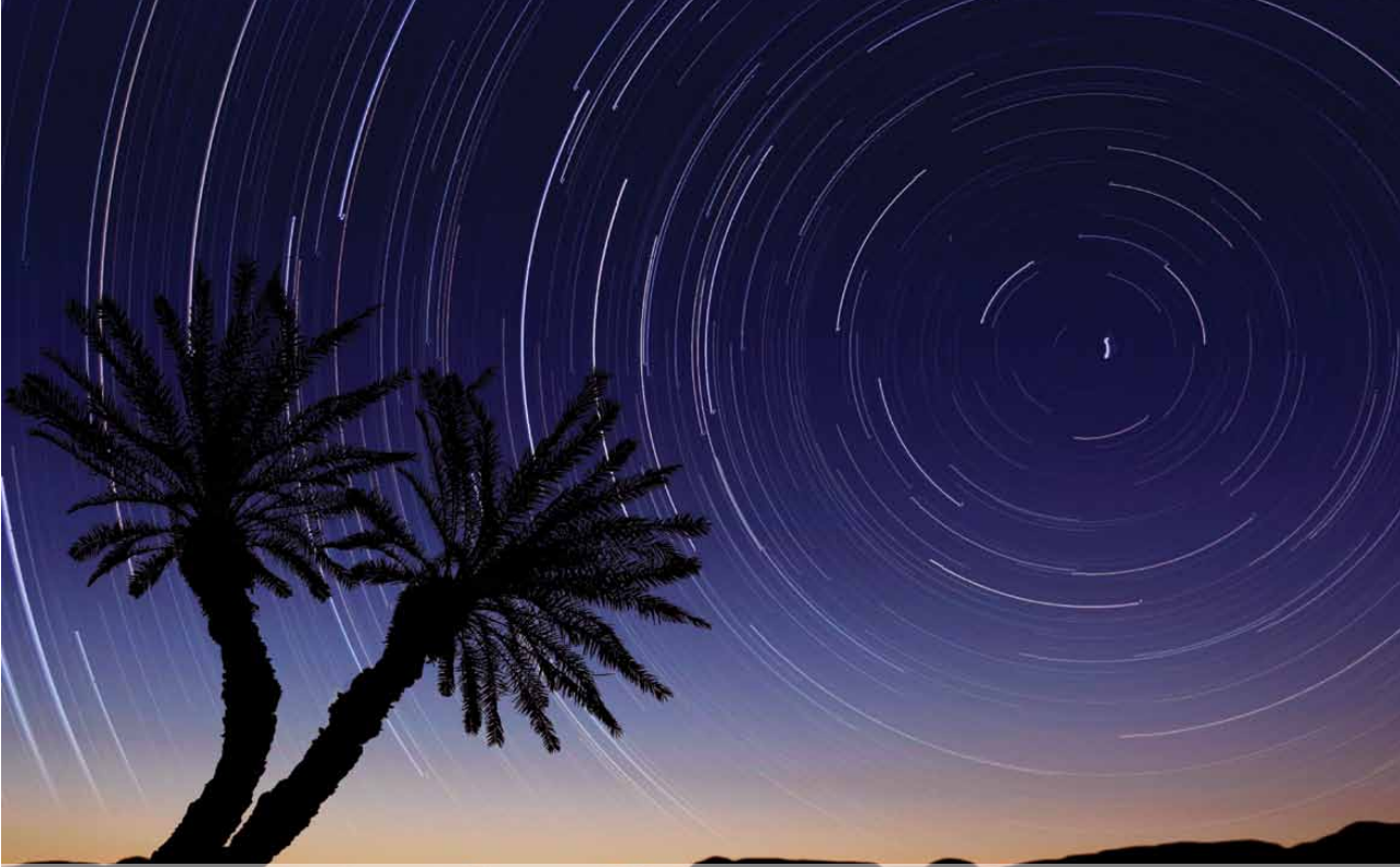
صورة مميزة في مسابقة النخلة في عيون العالم 2011