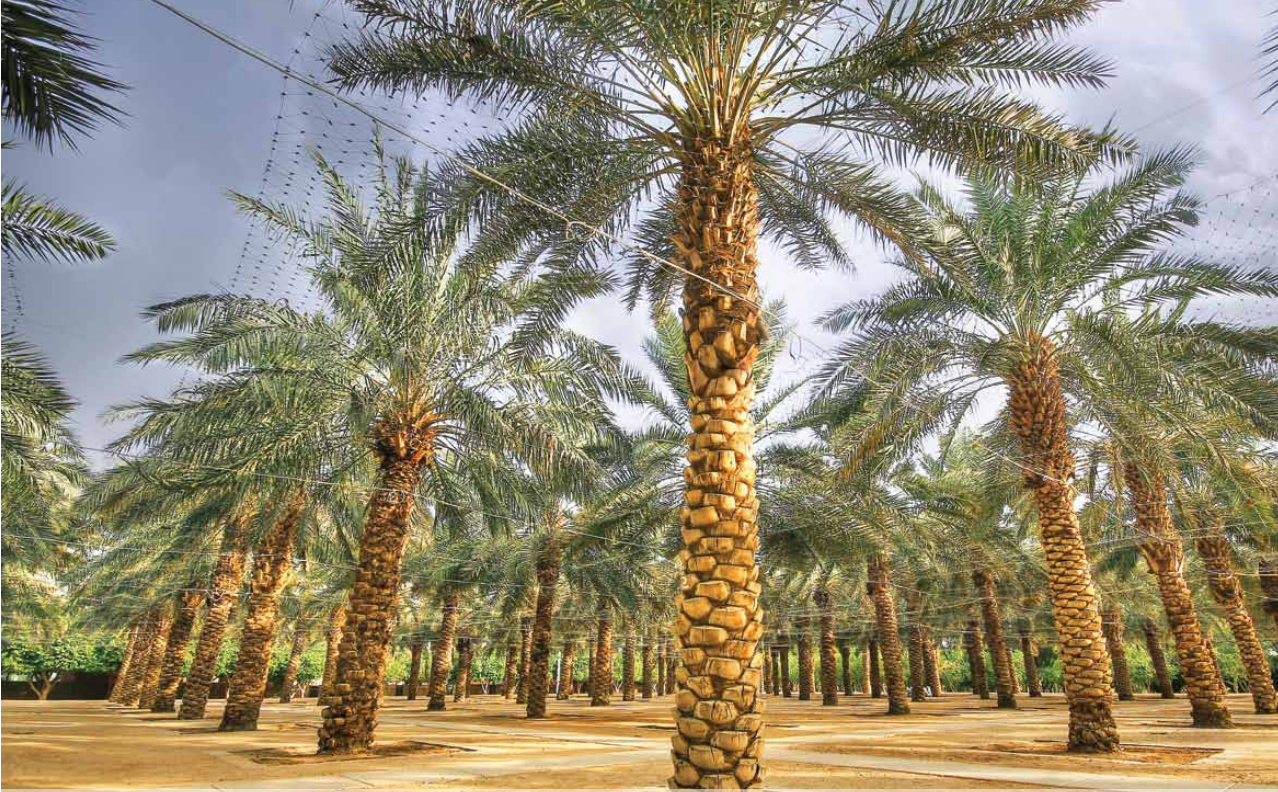
صورة مميزة في مسابقة النخلة في عيون العالم 2011