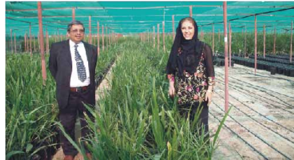
فريق أنول خلال زيارته مشاتل الساحل الأخضر في إمارة الفجيرة، الإمارات العربية المتحدة