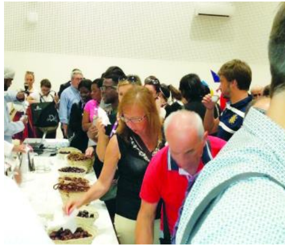
إقبال كبير شهده جناح الجائزة في المعرض