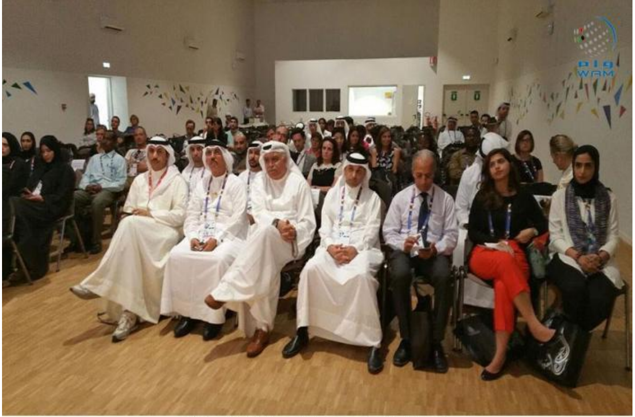
جائزة خليفة الدولية لنخيل التمر تعلن أسماء الفائزين بمسابقة " النخلة في عيون العالم "