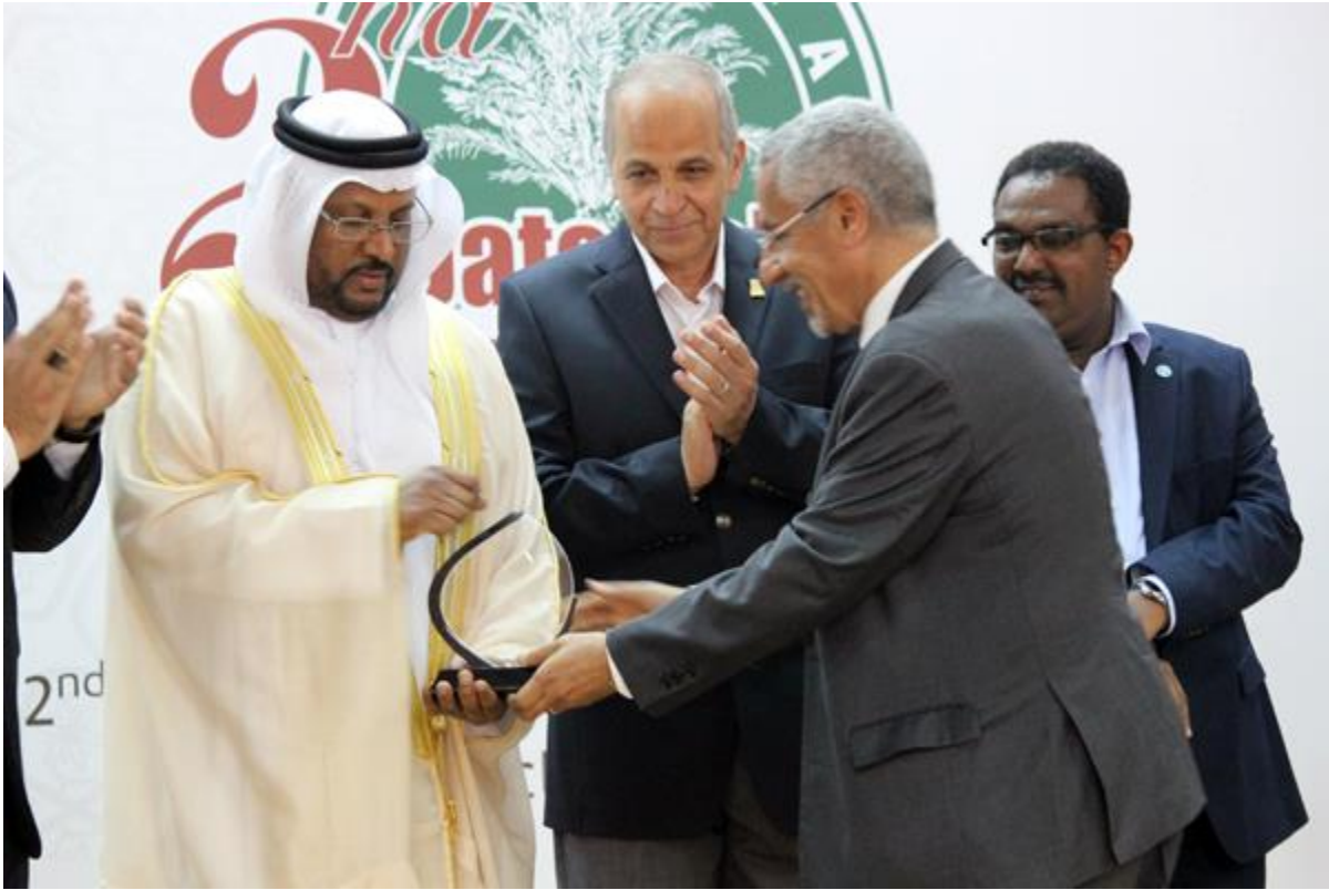
كتبه: Imad Saad