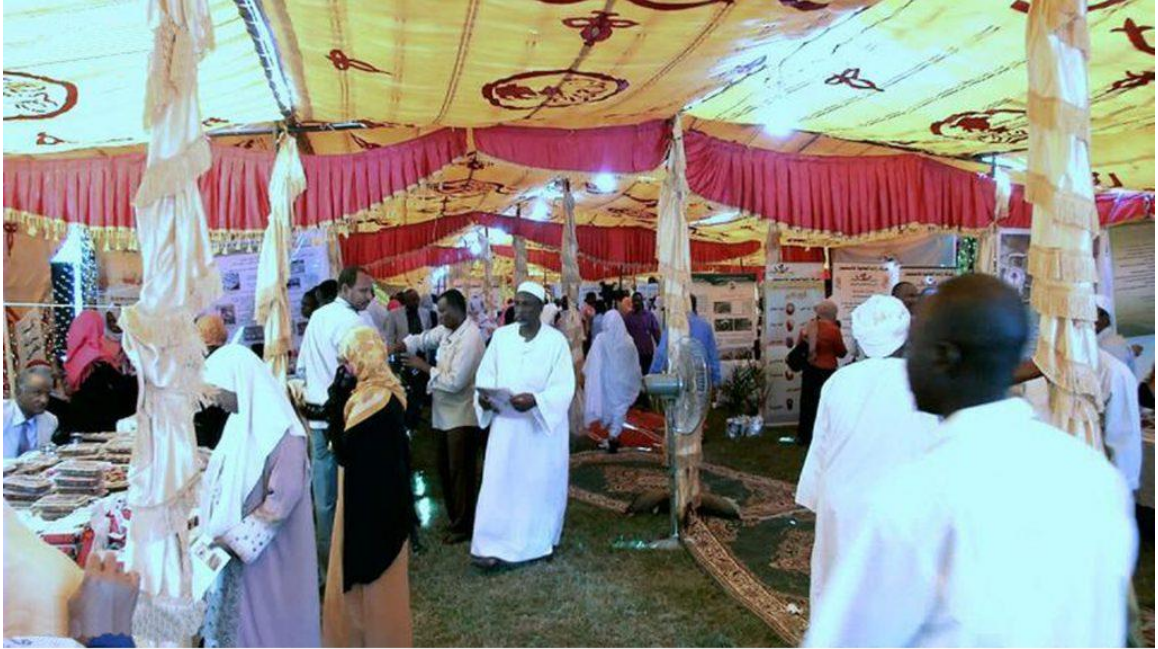
"خليفة لنخيل التمر" تشارك في مهرجان التمور في الخرطوم .

وام – الخرطوم شاركت الأمانة العامة لجائزة خليفة الدولية لنخيل التمر والابتكار الزراعي في مهرجان النخيل والتمور التاسع، الذي استمر سبعة أيام في العاصمة السودانية الخرطوم . وأفاد أمين عام الجائزة الدكتور عبدالوهاب زايد بأن مشاركة الجائزة في المهرجان تأتي جزءاً من التزامها بتعريف الفئات المستهدفة على المستوى العربي والدولي بأنشطتها ودورها في تحفيز العاملين في قطاع زراعة النخيل وإنتاج التمور- وتمكينهم من المشاركة بفئات الجائزة وتعزيز التنافسية بين مختلف الجهات على المستويين العربي والدولي. وثنى جهود جمعية الفلاحة ورعاية النخيل السودانية في تنظيم الحدث، مؤكداً دعم الأمانة العامة للجائزة لجهود دفع عجلة تطوير قطاع النخيل وإنتاج التمور في السودان، لما له من أثر إيجابي على مستوى الأفراد والأسر باعتبار النخلة تمثل جزءاً أساسياً من الحياة الاجتماعية السودانية.