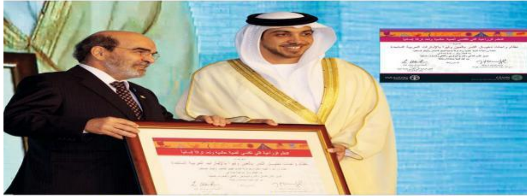
الإعتراف الأممي بنظام واحات نخيل التمر بالعين وليوا نظاماً زراعياً ذا أهمية عالمية