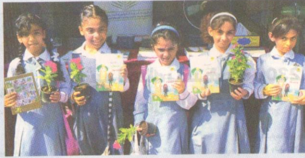
جانب من مناسبات معرض النخلة الرابع في دبا الحصن أخيراً، (الرؤية)

وأضاف أن المشاركات تأتي أيضاً لإبراز دور الإمارات باعتبارها الدولة التي تصنف الأولى عالمياً من حيث المناشط والمشاريع الخاصة بتطوير هذا القطاع والارتقاء به.