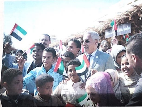
مطلة المدارس خلال زهرة المهرجان

شهد مهرجان التمور المصرية بسيوة 2018 في محافظة مرسى مطروح بجمهورية مصر العربية، إقبالاً جماهيرياً لافتاً في دورته للعام 2018، والتي تقام برعاية فخامة الرئيس عبد الفتاح السيسي، رئيس جمهورية مصر العربية، ودعم سمو الشيخ منصور بن زايد آل نهيان، نائب رئيس مجلس الوزراء وزير شؤون الرئاسة، ومتابعة معالي الشيخ نهيان بن مبارك آل نهيان، وزير التسامح،