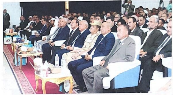
وزير الزراعة والتجارة ومحافظ مطروح وعبد الوهاب زايد وعدد من المسؤولين خلال إطلاق فعاليات المهرجان

أن المهرجان حضره من مصر كل من معالي الدكتور عز الدين أبوستيت وزير الزراعة واستصلاح الأراضي، ومعالي المهندس وزير التجارة والصناعة، ومعالي اللواء مجدي الغرابلي، محافظ مطروح، والمهندس شعبان معراف، رئيس مجلس مدينة سيوة، وعدد من شيوخ قبائل سيوة، وملاك المزارع في المنطقة، وخبراء وأكاديميون من داخل مصر وخارجها.