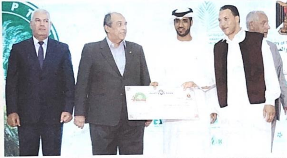
وزير الزراعة والتجارة ومحافظ مطروح خلال تكريم الفائزين بحضور عبد الوهاب زايد