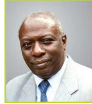
معالي الدكتور جاك ضيوف

وزير الفلاحة والصيد البحري المملكة المغربية