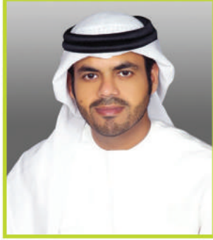
سعادة المهندس سيف محمد الشرع

الوكيل المساعد بوزارة البيئة والمياه للشؤون الزراعية والحيوانية