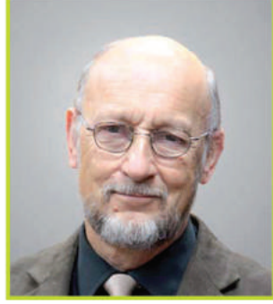
الأستاذ الدكتور فرانز هوفمان رئيس اللجنة العلمية