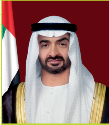
الفريق أول سمو الشيخ محمد بن زايد آل نهيان ولي عهد أبوظبي نائب القائد الأعلى للقوات المسلحة

إن عبقرية المغفور له الشيخ زايد في مجال الزراعة تكمن في تحدي المستقبل، وهذا يدفعنا إلى تمثّل خطاه، وألا نرى مانعاً يمنعنا من السعي إلى تحقيق كل أحلامنا من أجل مستقبل أفضل. وأن نرى المستقبل بعقولنا وبصيرتنا ونتخيله بأحلامنا على الصورة التي نريد. فالواقع الذي نعيشه الآن كان في مرحلة سابقة صورة في خيال المغفور له الوالد الشيخ زايد بن سلطان آل نهيان رحمه الله تعالى وأجزل له المثوبة.