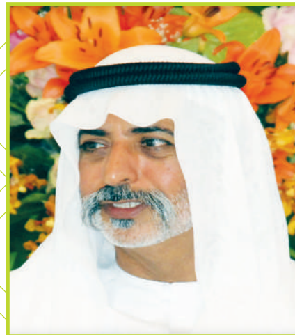
معالي الشيخ نهيان مبارك آل نهيان وزير الثقافة والشباب وتنمية المجتمع رئيس مجلس الأمناء