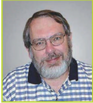
الأستاذ الدكتور هاريسون هيوز

عضو اللجنة العلمية الولايات المتحدة لأمريكية