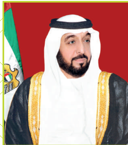
صاحب السمو الشيخ خليفة بن زايد آل نهيان رئيس دولة الإمارات العربية المتحدة مؤسس الجائزة وراعيها «حفظه الله»

لقد عملت دولة الإمارات العربية المتحدة منذ إنشائها، على تحقيق التوازن بين ما تنشده من نهضة اقتصادية واجتماعية، وبين الحفاظ على موروثاتها الثقافية والاجتماعية والبيئية، في تجربة فريدة تؤكد نجاح نموذج التنمية المستدامة، الذي أرسى دعائمها المغفور له بإذن الله، الوالد الشيخ زايد بن سلطان آل نهيان، رحمه الله، والذي عمل منذ وقت مبكر على وضع أسس راسخة لحماية البيئة، وتؤكد اليوم سيرتنا على ذات النهج، ودعمنا للاستكمال البناء المؤسسي والتشريعي، وتعزيز الجهود الرسمية والشعبية للحفاظ على البيئة والحياة الفطرية.