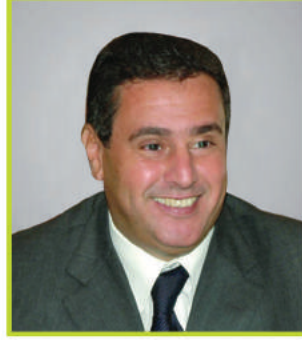
معالي عزيز أخنوش

الوكيل المساعد بوزارة البيئة والمياه للشؤون الزراعية والحيوانية