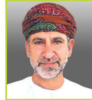
معالي الدكتور طارق بن موسى الزدجالي

المدير السابق لمنظمة العربية للتنمية الزراعية