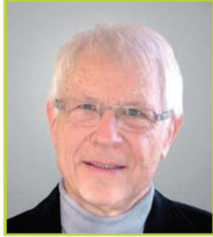
الأستاذ الدكتور فرانسيس مارتني

عضو اللجنة العلمية الولايات المتحدة لأمريكية