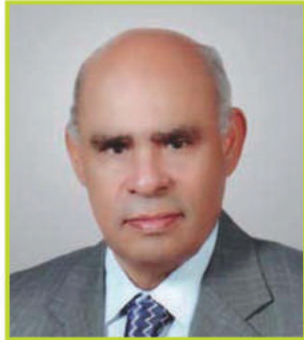
الأستاذ الدكتور حسن شبانة

عضو اللجنة العلمية منظمة الأغذية والزراعة (الفاو)