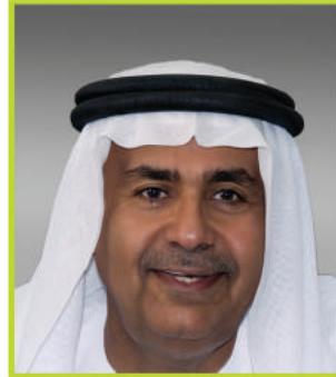
سعادة الدكتور غالب علي الحضرمي

نائب مدير الجامعة لشؤون الطلبة والتسجيل - جامعة الإمارات العربية المتحدة