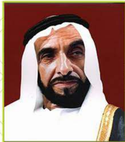
المغفور له بإذن الله الشيخ زايد بن سلطان آل نهيان (طيب الله ثراه)

” النهضة الزراعية... دعامة من دعائم الاتحاد “