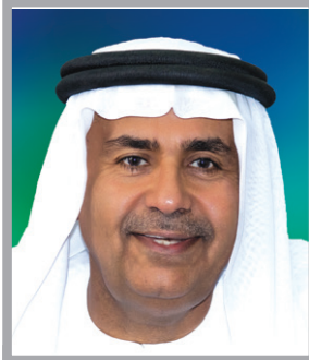
سعادة الدكتور غالب علي الحضرمي

كبير خبراء فنيين جامعة الإمارات العربية المتحدة