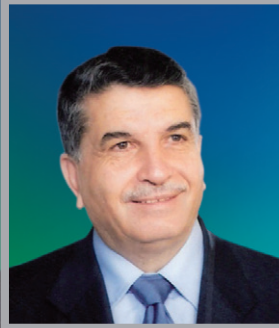
معالي الدكتور سالم اللوزي

المستشار الزراعي لصاحب السمو رئيس دولة الإمارات العربية المتحدة