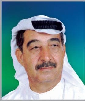
سعادة زهير أبو الأديب

المستشار الزراعي لصاحب السمو رئيس دولة الإمارات العربية المتحدة