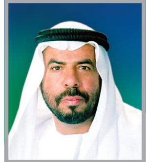
سعادة المهندس راشد محمد خلفان الشريقي

مدير إدارة الحدائق والمنتزهات الترفيهية بلدية مدينة العين الإمارات العربية المتحدة