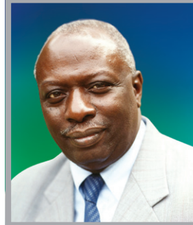
معالي الدكتور جاك ضيوف

مدير عام سابق المنظمة العربية للتنمية الزراعية