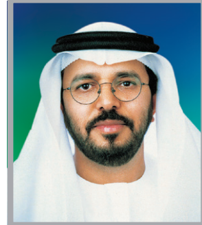
معالي الدكتور هادف جوعان الظاهري

مدير عام سابق منظمة الأغذية والزراعة للأمم المتحدة (الفاو)