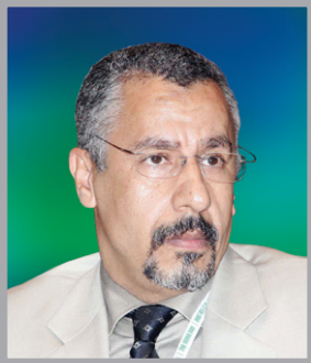
سعادة الاستاذ الدكتور عبد الوهاب زايد

كبير خبراء فنيين جامعة الإمارات العربية المتحدة