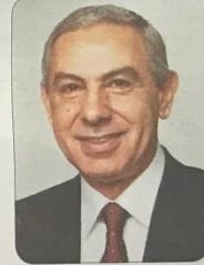
•• العين - الفجر