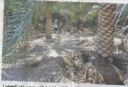
الجائزة تشرف على مشاريع بنية تحتية لتنمية نخيل التمر بمصر