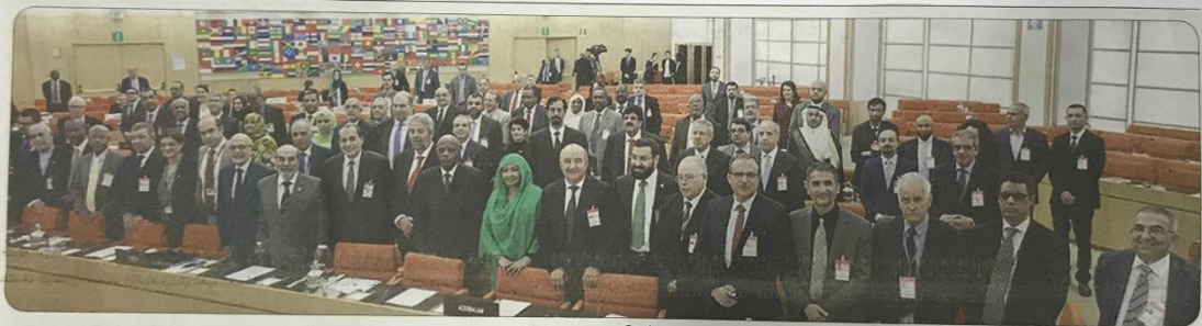
بدرته الـ34 بروما في إيطاليا