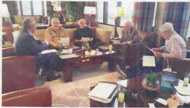
من اجتماع اللجنة العلمية للجائزة