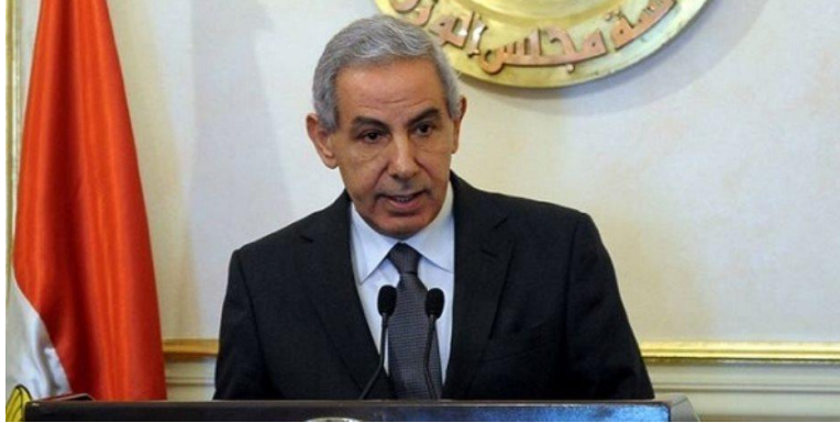
المهندس طارق قابيل وزير التجارة والصناعة

أعلن المهندس طارق قابيل وزير التجارة والصناعة أنه يجرى حالياً الإعداد لعقد مهرجان التمور المصرية في دورته الثالثة بواحة سيوة والمقرر عقده مطلع شهر نوفمبر المقبل تحت رعاية الرئيس عبد الفتاح السيسي وبالتعاون مع جائزة خليفة الدولية لنخيل التمر والإبتكار الزراعي بدولة الإمارات العربية المتحدة ، لافتاً إلى أن إقامة هذا المهرجان تأتي استكمالاً للنجاح الذي حققه المهرجان في دورته الأولى والثانية ، حيث نجح في تسليط الضوء على أهمية قطاع التمور المصرية بإعتباره إحدى القطاعات التصديرية الواعدة والتي تمتلك مصر فيها مزايا تنافسية كبيرة حيث تقوم مصر بإنتاج 18% من الإنتاج العالمي و23% من الإنتاج العربي من التمور محتلة بذلك المرتبة الأولى عالمياً وعربياً في إنتاج التمور يليها السعودية والعراق والإمارات