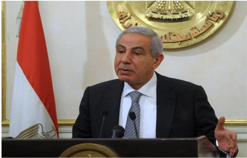
المهندس طارق قابيل وزير التجارة والصناعة

قال طارق قابيل، وزير التجارة، إنه يجرى حالياً الإعداد لعقد مهرجان "التمور المصرية" في دورته الثالثة بواحة سيوة والمقرر عقده مطلع شهر نوفمبر المقبل تحت رعاية الرئيس عبد الفتاح السيسي وبالتعاون مع جائزة خليفة الدولية لنخيل التمر والإبتكار الزراعي بدولة الإمارات العربية المتحدة.