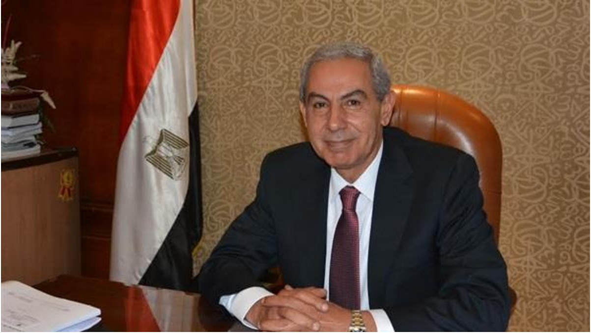
طارق قابيل وزير الصناعة ولاء عبد الكريم

أعلن المهندس طارق قابيل، وزير التجارة والصناعة، أنه يجري حاليا الإعداد لعقد مهرجان التمور المصرية في دورته الثالثة بواحة سيوة، والمقرر عقده مطلع شهر نوفمبر المقبل تحت رعاية الرئيس عبد الفتاح السيسي وبالتعاون مع جائزة خليفة الدولية لنخيل التمر والابتكار الزراعي بدولة الإمارات العربية المتحدة.