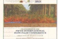
غلاف الكتاب (الرؤية)

بمبادرة خليفة الرئاسة لنخيل التمر بهدف الإثراء بقطاع نخيل التمور وإيجاد أفضل الطرق إلى تحسين الإنتاج ومعالجة أحدث التقنيات والتكنولوجيا في عمليات الري والتصنيع والتغليف والتسويق.