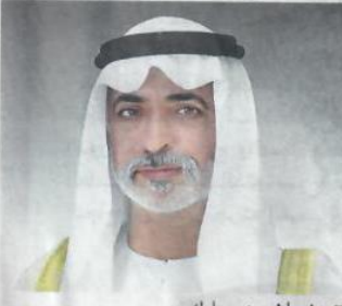
■ نهيان بن مبارك

وأضاف معاليه أن الأمانة العامة لجائزة خليفة الدولية لنخيل التمر والابتكار الزراعي وبرعاية كريمة من صاحب السمو الشيخ خليفة بن زايد آل نهيان، رئيس الدولة، حفظه الله، واهتمام صاحب السمو الشيخ محمد بن زايد آل نهيان، ولي عهد أبوظبي، نائب القائد الأعلى للقوات المسلحة، ودعم سمو الشيخ منصور بن زايد آل نهيان نائب رئيس مجلس الوزراء وزير شؤون الرئاسة، تحرص دائماً على التفاعل مع تحديات المجتمع الزراعي بدولة الإمارات والعالم بالبحث والدراسة العلمية، وصولاً لاقتراح البدائل وطرح الخيارات وتطبيقها على أرض الواقع بالتعاون مع الشركاء في تلك الدول وخير مثال على ذلك النجاح، الذي حققته الجائزة في تنظيم مهرجان التمور المصرية بسيوة خلال ثلاث سنوات وما رافقه من تجهيز وتطوير مصنع التمور للحكومي بسيوة، وبناء برادات خاصة للتمور بمحافظة الوادي الجديد ومحافظة الجيزة بجمهورية مصر العربية، والمهرجان الدولي الأول للتمور السودانية بالخرطوم.