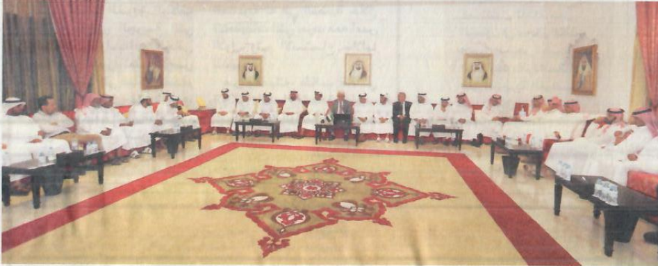
جانب من فعاليات اللقاء مع الفائزين

أكد الدكتور عبدالوهاب زايد، أمين عام جائزة خليفة الدولية لنخيل التمر والابتكار الزراعي، خلال لقاء مفتوح مع الفائزين بجائزة المزارع المتميز والمزارع المبتكر 2018 بمجلس محمد خلف المزروعى بأبوظبي، أمس الأول، أن القطاع الزراعي ونخيل التمر على وجه الخصوص لطالما كان يمثل جزءاً مهماً في فكر وحياة المغفور له، بإذن الله، الشيخ زايد بن سلطان آل نهيان، طيب الله ثراه، وظلت الشجرة المباركة تحظى بهذه الرعاية طوال عقود.