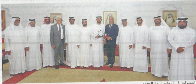
المشاركون في المجلس