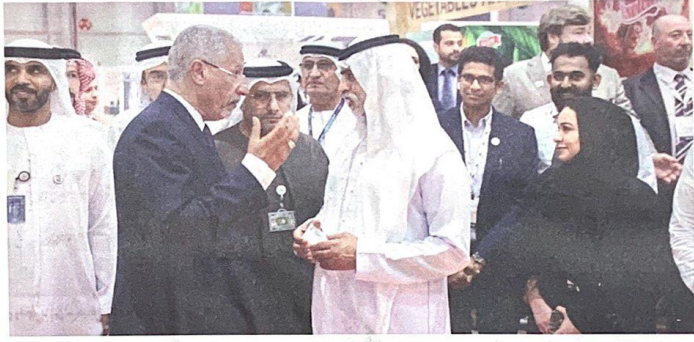
نهيان بن مبارك خلال زيارته المعرض

زار معالي الشيخ نهيان بن مبارك آل نهيان، وزير التسامح، رئيس مجلس أمناء جائزة خليفة الدولية لنخيل التمر والابتكار الزراعي، معرض أبوظبي الدولي للتمور في نسخته الخامسة في أرض المعارض بأبوظبي، وتقدّم أجنحة الدول المشاركة، وأثنى على جهود الجائزة في احتضان واستقطاب 78 عارضاً يمثلون 12 دولة حول العالم، وأكد معاليه أن ما حققتّه جائزة خليفة الدولية لنخيل التمر والابتكار الزراعي في تنمية وتطوير البنية التحتية لقطاع زراعة النخيل وإنتاج التمور على المستوى العربي، كان مفخرة كبيرة لدولة الإمارات العربية المتحدة نعتز بها، وأضاف بأن جائزة خليفة الدولية لنخيل التمر والابتكار الزراعي تأسست بهدف النهوض بهذا القطاع على المستوى الوطني والعربي والدولي، تلبية لرؤية صاحب السمو الشيخ خليفة بن زايد آل نهيان، رئيس الدولة، حفظه الله، وتوجيهات صاحب السمو الشيخ محمد بن زايد آل نهيان، ولي عهد أبوظبي نائب القائد الأعلى للقوات المسلحة، ودعم سمو الشيخ منصور بن زايد آل نهيان، نائب رئيس مجلس الوزراء وزير شؤون الرئاسة، على وأضاف في تصريح صحفي، على