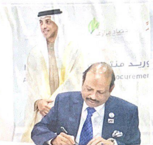
خلال توقيع الاتفاقية