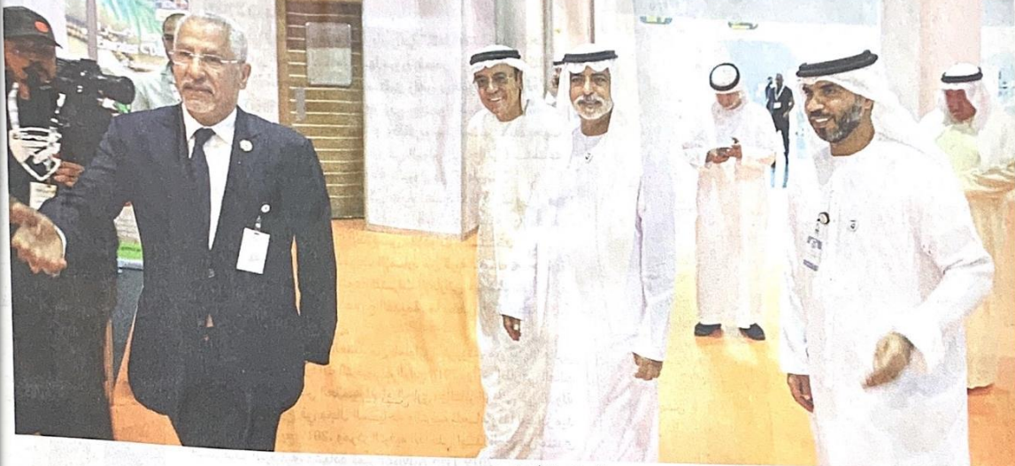
■ نهيان بن مبارك خلال تفقده أجنحة معرض أبوظبي للتمور بحضور زكي نسبة

مزارع أبوظبي، حسب توفرها خلال الموسم الزراعي إلى مجموعة اللولو التي تتولى تسويقها عبر منافذها الواسعة بالإمارات، وذلك مقابل سعر متفق عليه بين الطرفين، وترتبط هيئة أبوظبي للزراعة والسلامة الغذائية بعقود توريد مع أكثر من 600 مزرعة في إمارة أبوظبي تتولى بموجبها تسويق منتجات هذه المزارع تحت اسم العلامة التجارية «حصاد مزارعنا» في السوق المحلي.