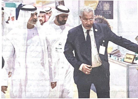
..ومعاليه خلال جولته في أجنحة المعرض