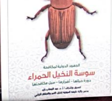
الجهود الدولية لمكافحة سوسة النخيل الحمراء دولة خليفة - الإمارات - أبوظبي تحت إشراف: د. محمد الفاضل مترجم: د. محمد الفاضل نائب مدير العلاقات العامة

مكوناً لبل مدتهما في التمهيد من التناوب الإقليمي والدولي الفاعل في مجالات حماية البيئة، والتكيف مع التغيرات المناخية، في البصرة الاقتصادية والاجتماعية، في الأقطار المنحددة بالتنسيق مع العالم وفقاً لما أقرت عليه من قدرته الكبير، جهود كافة وزارات الزراعة في الدول المتخمة والصديقة، وأحياناً قد تفتقر جهود المنظمات الدولية المختصة، إنه لا يمكن التغلب على هذه المشكلة إلا بالتعاون بين الدول الأعضاء على أرضها المشتركة، على كل المستويات، بدءاً من القطاع في 2018 م من القطاع الكبير، بالتعاون العربية والإنجليزية.