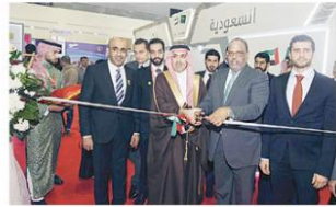
الوزير ومعاونيه خلال افتتاح جناح الإمارات المشارك (بمسرحية من إعداد)

3.3 مليار دولار صادرات السلع الغذائية الإماراتية إلى دول العالم، في 2018