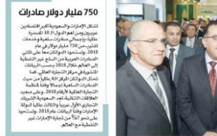
الوزير ومعاونيه خلال افتتاح جناح الإمارات المشارك (بمسرحية من إعداد)

35 شركة صناعات غذائية ومنتجات زراعية تستعرض أكثر من 120 علامة تجارية