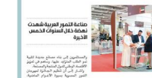
جناح الإمارات خلال معرض خليفة للتمر، فبراير 2018م

تشارك الإمارات والسعودية في معرض «جائزة خليفة لنخيل التمر» الذي يقام في القاهرة من 13 إلى 15 يونيو 2018. ويضم المعرض 120 جناحاً من دول العالم، ويشارك فيه 350 شركة من مختلف دول العالم. وتعد الإمارات والسعودية من الدول المشاركة في هذا المعرض، حيث ستعرض الإمارات 35 شركة صناعات غذائية ومنتجات زراعية، وتعرض السعودية 35 شركة صناعات غذائية ومنتجات زراعية.