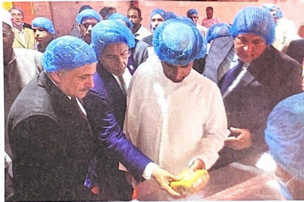
■ خلال حفل تسليم المجمع | وام

يهدف تعظيم القيمة المضافة لتمور المحافظة وتوفير فرص العمل لأبنائها وتحسين دخل المزارعين وحمائيتهم من تقلبات أسعار التمور بالسوق. وأضاف أن المشروع هدفه زيادة الطاقة الإنتاجية للمصنع إلى 5000 طن سنوياً والتنوع في خطوط الإنتاج وتحسين جودة المنتجات وإضافة منتجات جديدة باستخدام أحدث الماكينات والتقنيات العالمية بالتوافق مع الاشتراطات الصحية المعتمدة، مشيراً إلى أن قطاع التمور بالمحافظة يتركز بواحات الخارجة والداخلية والفرافرة ويمثل مصدر الدخل الرئيس لأهالي الواحات.