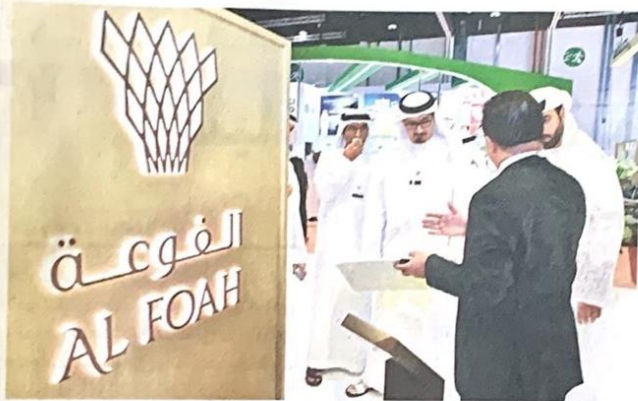
■ خلال المشاركة في الدورة السابقة | من المصدر

للتمر في نسخته لهذا العام مسيرته الناجحة ودوره المحوري في تسليط الضوء على أهمية التمور وتعزيز تجارة التمور من خلال توفير الدعم لكبار المستوردين وأبرز المشترين، كما يشكل المعرض فرصة مثالية للتواصل واللقاء بين الموردین ومزودي التمور من جميع أنحاء العالم، بما في ذلك دولة الإمارات العربية المتحدة».