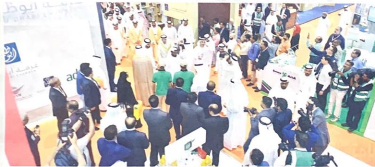
من المعرض في دورة سابقة