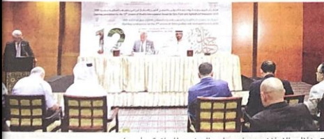
■ خلال الإعلان عن فتح باب الترشيح للجائزة